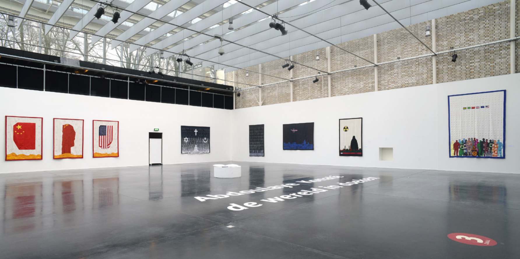
Beeld van de recente solotentoonstelling van Abdoulaye Konaté in het Afrika Museum

Afrikaanse en katholieke elementen fuseerden. Die religies vormen weer een inspiratiebron voor hedendaagse kunstenaars. Het museum kiest voor kunstenaars die een mondiaal blikveld verbinden aan een eigen culturele klankkleur. Konaté is bij uitstek een transculturele kunstenaar. Hij is in elk opzicht internationaal georiënteerd, maar put wel uit Malinese bronnen. Zo is de vorm van Offrandes de Couleurs ontleend aan het traditionele Afrikaanse jagerstuniek. Het reliëfpatroon rondom de compositie verwijst naar de gris gris , amuletten die jagers op hun tuniek dragen. Materialen en kleuren worden in de traditionele en hedendaagse kunst uit Afrika nooit zomaar gebruikt. Alles heeft betekenis. De verticale rode, zwarte en witte banen staan voor: het (dieren)offer, kracht, vitaliteit (rood), de aarde en de mensenwereld (zwart) en de geestelijke dimensie (wit). Onderaan zien we kolanoten die Konaté hier gebruikt als kleurenoffer (rood en wit), maar die in West-Afrika ook worden gebruikt voor het raadplegen van het orakel. In deze enorme abstracte compositie komt een complexe Afrikaanse levensbeschouwing tot uitdrukking waarin de relatie tussen mensen- en geestenwereld centraal staat.