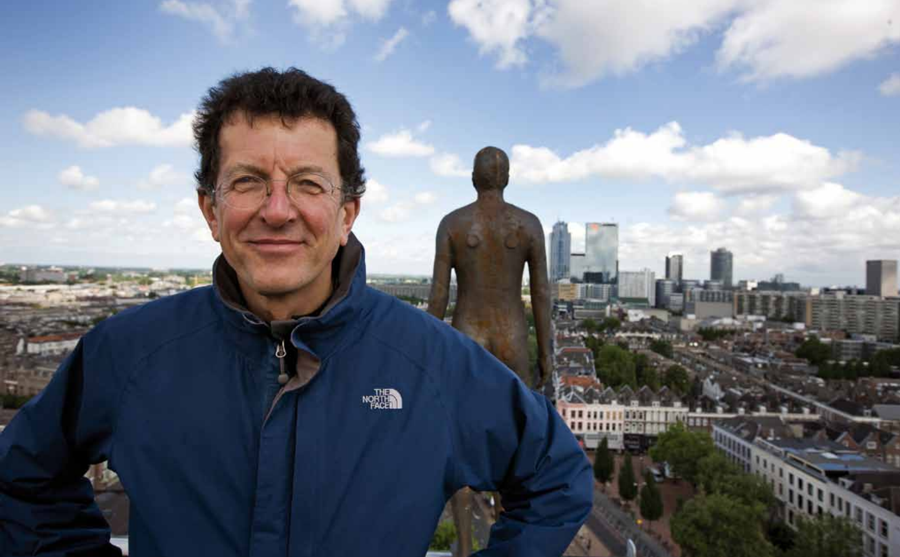
Antony Gormley bij de installatie van Event Horizon op het dak van het Parkhotel Rotterdam, 2008.

het beeld, dat scherp tegen de horizon aftekent, als een opvallende verschijning tot in lengte van dagen de menselijke maat aangeven.