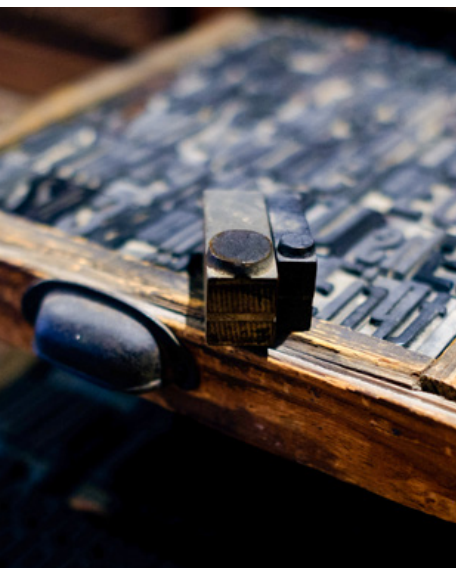
Houten zetmateriaal waaronder de twee houten punten die Werkman vermoedelijk heeft gebruikt in Compositie (D-52) uit 1929.

twee verschillende houten punten gebruikt, die nu deel uitmaken van de inventaris van GRID. Het lijkt erop dat Werkman deze houten punten in meerdere druksels heeft ingezet en ook in zijn drukwerk in oplage heeft gebruikt.