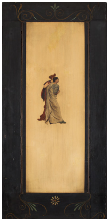
Interieur van de San Clemente in Rome Lawrence Alma-Tadema 1863. Olieverf op doek, 63,5 x 51 cm FRIES MUSEUM, LEEUWARDEN