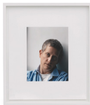
Uit de serie a.k.a. Roni Horn 2008-09. 30 foto's, elk 38,1 x 33 cm