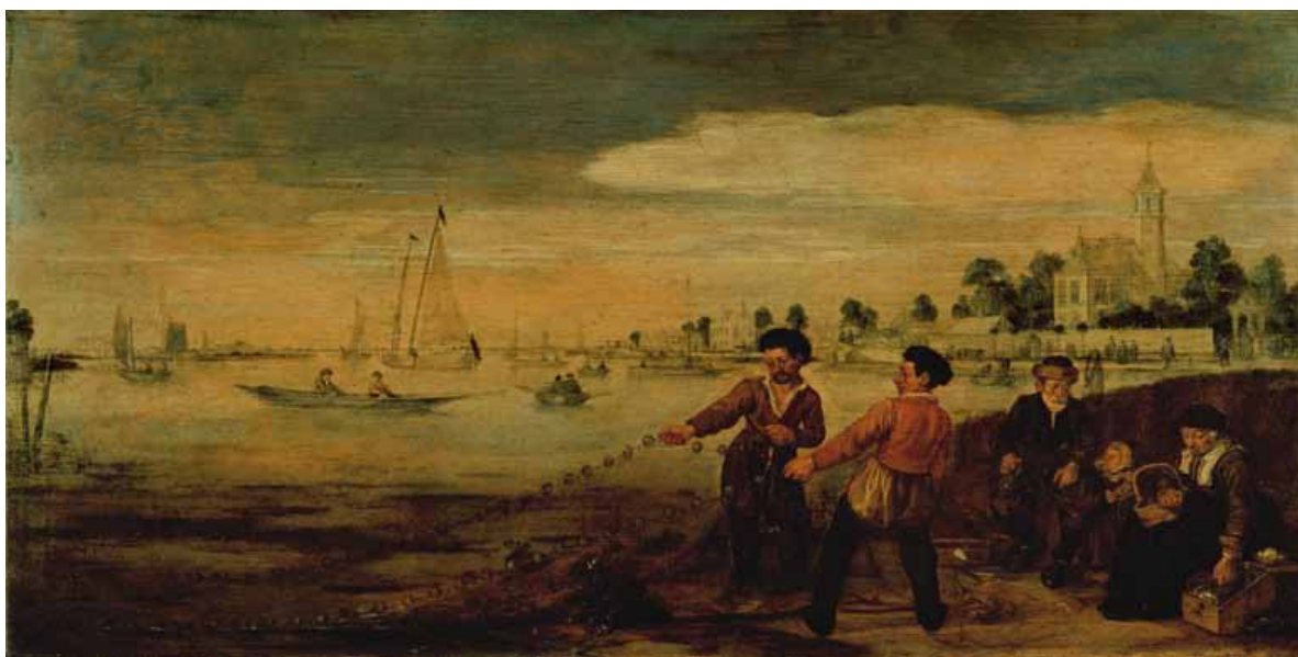
Vissers aan de Amstel bij de Pauwentuin Arent Arentsz Cabel (1585/86-1631) Vóór 1632. Olieverf op paneel, 25,5 x 50,5 cm AMSTERDAMS HISTORISCH MUSEUM (BRUIKLEEN RIJKSMUSEUM)

Het bestaan van dit Gezicht op Amsterdam vanaf de Amsteldijk was weliswaar bekend, maar pas in 2006 was het doek voor het eerst sinds mensenheugenis weer te zien. Afkomstig uit de collectie van Frits Philips werd het in december van dat jaar geveild en door de kunsthandel aangekocht. Veel bekender tot dan toe was het gelijkwaardige doek in het Fitzwilliam Museum te Cambridge. 3 Hoewel beide voorstellingen het uitzicht tonen vanaf