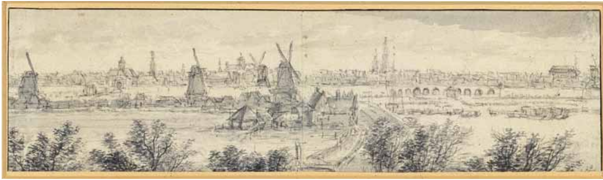
Gezicht op Amsterdam vanaf de Amsteldijk Jacob van Ruisdael Ca. 1675/80. Zwart krijt, grijs gewassen, 8,4 x 31 cm (samengesteld uit twee losse bladen) MUSEUM DER BILDENDEN KÜNSTE, LEIPZIG

hetzelfde standpunt, zijn er opvallende verschillen, vooral in de gekozen beeldhoek. Het panorama te Cambridge is aan de linkerkant op dezelfde plaats begrensd als de tekening: links van een van de molens aan de Zaagmolensloot. Ons uitzicht gaat verder; het toont nóg vier molens, waarvan de drie achterste de bocht van de zuidelijke stadswal suggereren. Aan de horizon is de Leidsepoort herkenbaar aan het middentorentje. Het gebouw, dat door Ruisdael naar rechts is verschoven, lijkt van plaats te hebben gewisseld met het Aalmoezeniersweeshuis aan de Prinsengracht, dat mag worden herkend in het hoge gebouw rechts van de twee meest linkse molens. Doordat de poort meer naar rechts staat, krijgt de kromming van de stadsmuur impliciet meer nadruk. Deze topografische manipulatie klinkt misschien