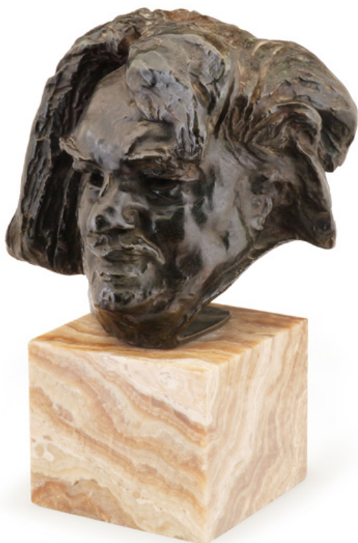
Portretkop van Honoré de Balzac Auguste Rodin ca. 1897. Brons, H. 18,3 cm SINGER LAREN