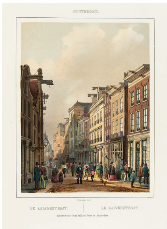
Kalverstraat Cornelis Springer 1848. Handgekleurde lithografie, 238 x 183 mm