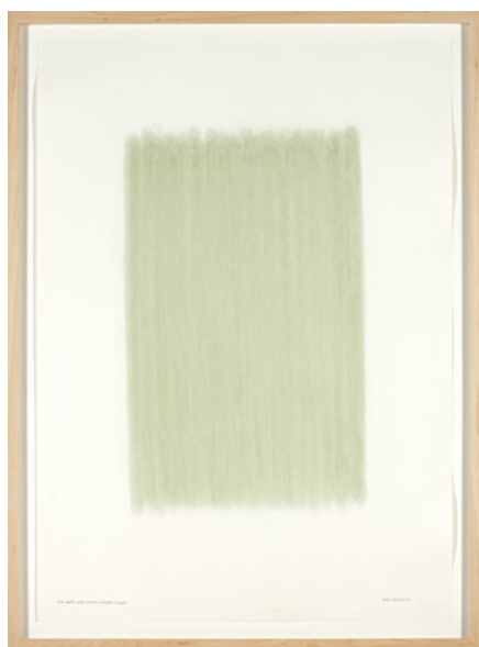
from earth: hermigua, la gomera herman de vries 2002. Aarde op papier, 70 x 50 cm STEDELIJK MUSEUM SCHIEDAM