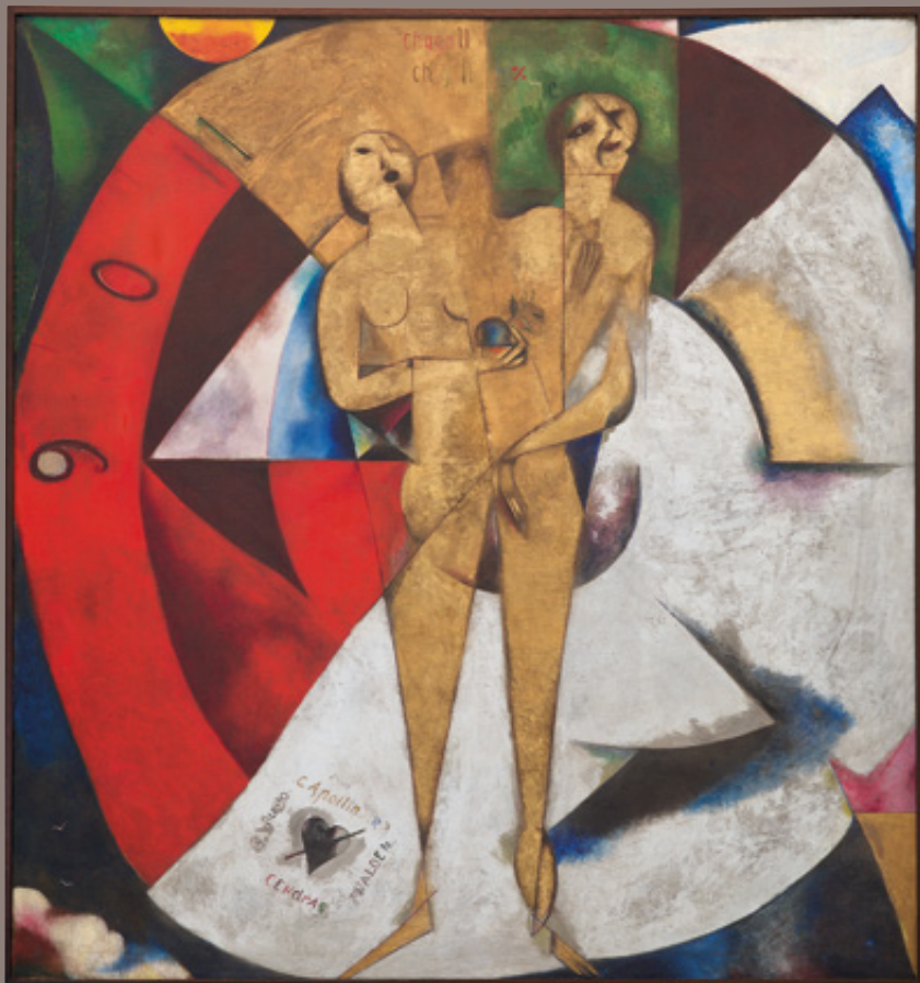
Hommage à Apollinaire Marc Chagall 1913. Olieverf op doek, 200,4 x 189,5 cm VAN ABBEMUSEUM, EINDHOVEN (Gesteund door de Vereniging Rembrandt in 1952)

'In de toekomst zou men dit werk van Chagall wel eens als een zeer belangrijke aankoop kunnen beschouwen, ook al zijn thans zeer vele niet geneigd aan deze kunstuiting waarde toe te kennen'