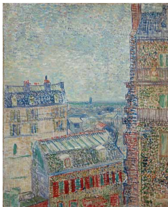
Gezicht vanuit Theo's appartement Vincent van Gogh 1887. Olieverf op doek, 46 x 38 cm VAN GOGH MUSEUM, AMSTERDAM (VINCENT VAN GOGH STICHTING)

Terwijl andere Nabis een voorkeur toonden voor motieven uit het huiselijke interieur, was Bonnard eind 19de eeuw vooral geïnteresseerd in het leven in de straten van de metropool. Elke ochtend struinde hij door de straten van Montmartre om het doen en laten van de stadsbewoners in zich op te nemen en te schetsen. Op basis daarvan maakte hij in het atelier zijn werken. Scènes in donker of schemer waren daarbij geen uitzondering. Voor het optekenen van Montmartre in de regen bleef Bonnard thuis: het toont het uitzicht vanuit zijn atelier in de rue Tholozé, de straat rechts waar het licht op het beregende plaveisel weerkaatst en we de aan Japanse prenten herinnerende silhouetten van figuurtjes met paraplu's zien lopen. De rue Tholozé komt daar uit op de rue des Abesses. In de rechterbovenhoek loopt de rue Lepic waar Theo van Gogh, broer van de kunstenaar, tien jaar eerder had gewoond.