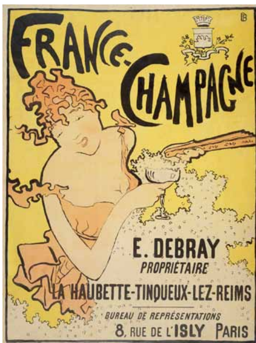
France-Champagne Pierre Bonnard 1889. Litho, 78 x 50 cm

Bonnards liefde voor Japanse prenten was in brede kring bekend. 'Bonnard, très Japonard' was zijn bijnaam in zijn vriendenkring. De sterke contouren van Japanse prenten, de tweedimensionaliteit en de schijnbaar willekeurige afsnijdingen van het beeld nam hij over in de affiches die hij rond 1890 maakte. De impressionisten hadden zich ook door de afsnijdingen van de Japanners laten beïnvloeden, maar waar zij er de vluchtigheid van het moment mee wilden oproepen, de indruk van een snap-shot , ging het Bonnard om een ander aspect: de afsnijdingen verwezen naar het niet-aanwezige, het grote geheel dat niet zichtbaar is. In deze Japanse opvatting, wabi sabi , bestaat schoonheid in dat wat niet gezien wordt, niet voltooid is, of vergankelijk. De dichter J.H. Leopold sprak van de 'rijkdom van het onvoltooid'. De afsnijdingen van Montmartre in de regen evoceren het leven van de grote stad dat niet in zijn totaliteit op het doek te vatten is.