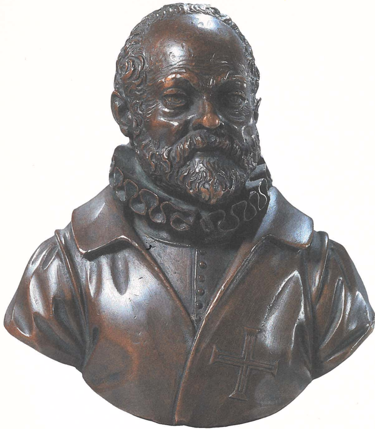
Zelfportret Giambologna Ca. 1600. Brons, H 9 cm RIJKSMUSEUM, AMSTERDAM

geheel zijwaarts is gericht. Hiermee drukte de kunstenaar een sterk zelfbewustzijn uit, een keizerlijk kunstenaar waardig.